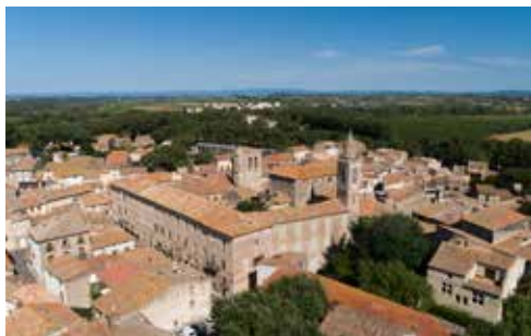
P.4. RÉVISION DU PLAN LOCAL D'URBANISME P. 4 : réunion publique de présentation du PADD