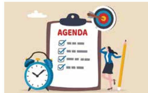
P.16 AGENDA Les festivités du trimestre