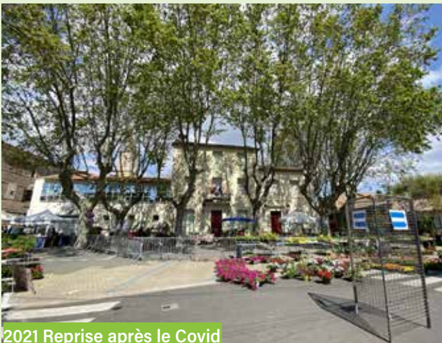
2021 Reprise après le Covid