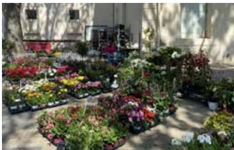
P. 8-9 DOSSIER SPECIAL Les 20 ans du grand marché du printemps