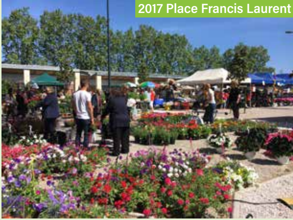
2017 Place Francis Laurent