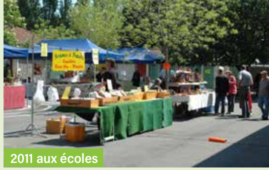
2011 aux écoles

Si vous souhaitez vous inscrire, contactez la mairie avant le 2 avril Tél. : 04 67 77 80 57 communication@saint-thibery.fr