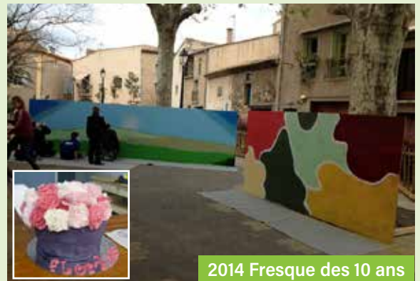
2014 Fresque des 10 ans