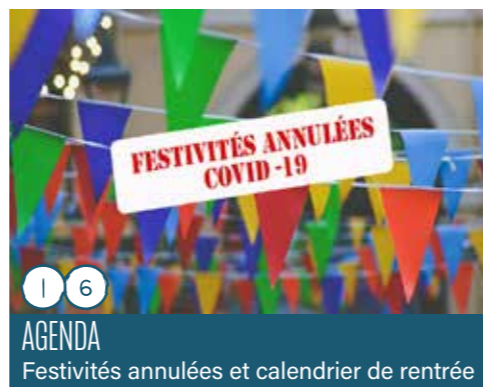
AGENDA Festivités annulées et calendrier de rentrée