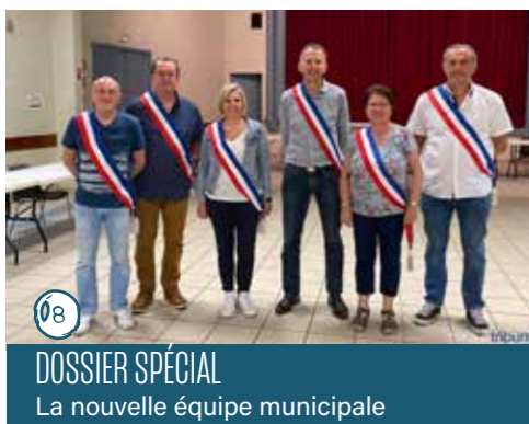
DOSSIER SPÉCIAL La nouvelle équipe municipale