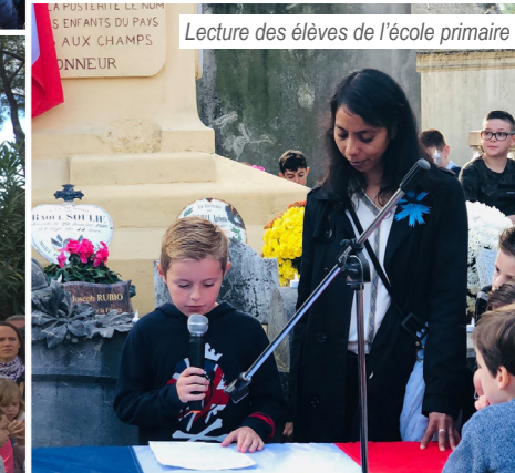
Lecture des élèves de l'école primaire