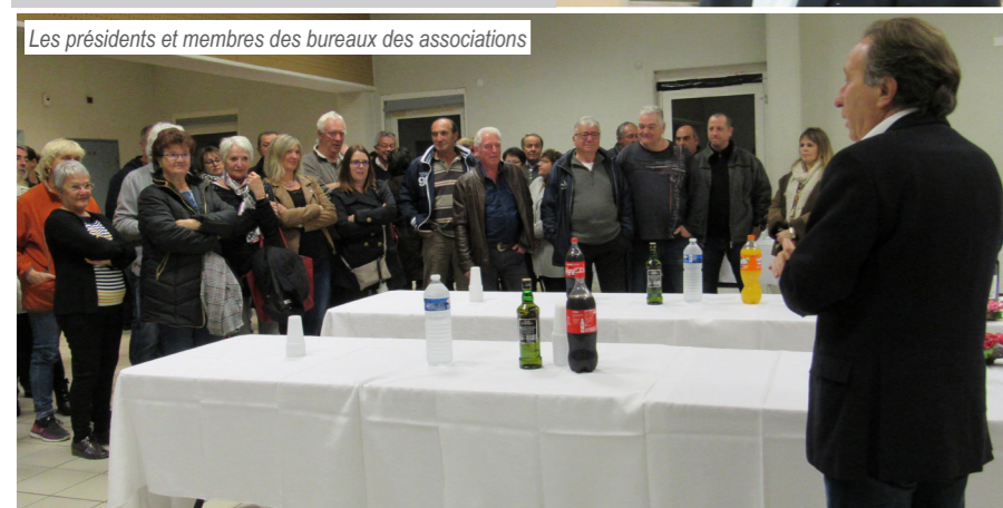
Les présidents et membres des bureaux des associations

16 novembre PRÉSENTATION DU LIVRE «LE PATELIN» À LA MÉDIATHÈQUE L'association pour la préservation du patrimoine a présenté son recueil de lettres de Poilus lors de la soirée animée par la médiathèque le 16 novembre dernier