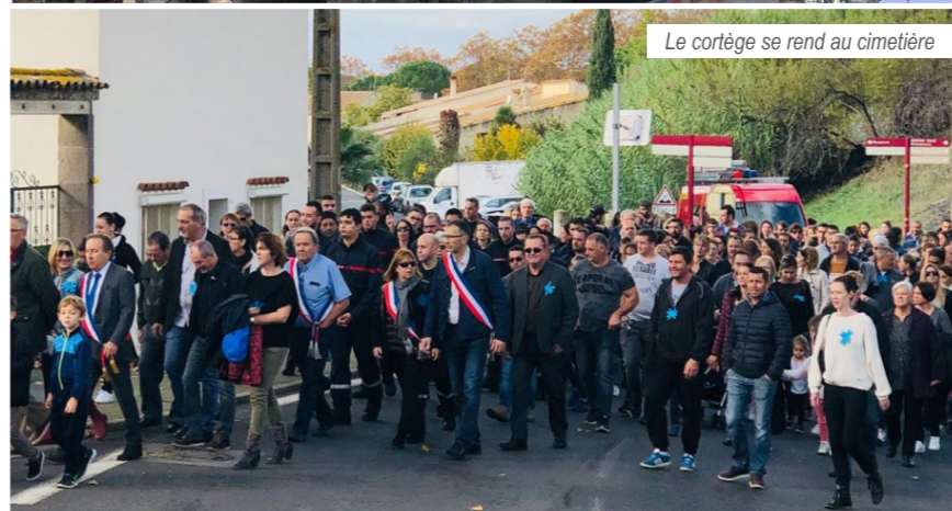
Le cortège se rend au cimetière