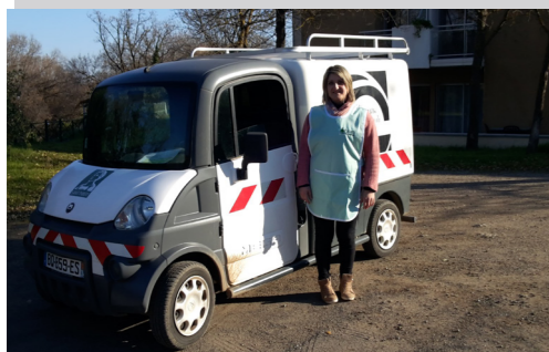
L'ADMR et son service de livraison de repas à domicile

Alors n'hésitez plus ! Venez les rencontrer au local de l'association, zone La Crouzette, 20 avenue Ricardo Mazza, SAINT-THIBÉRY ou contactez les au 04 67 77 95 46, du lundi au vendredi de 9H00 à 12H00 et de 13h30 à 17h30.