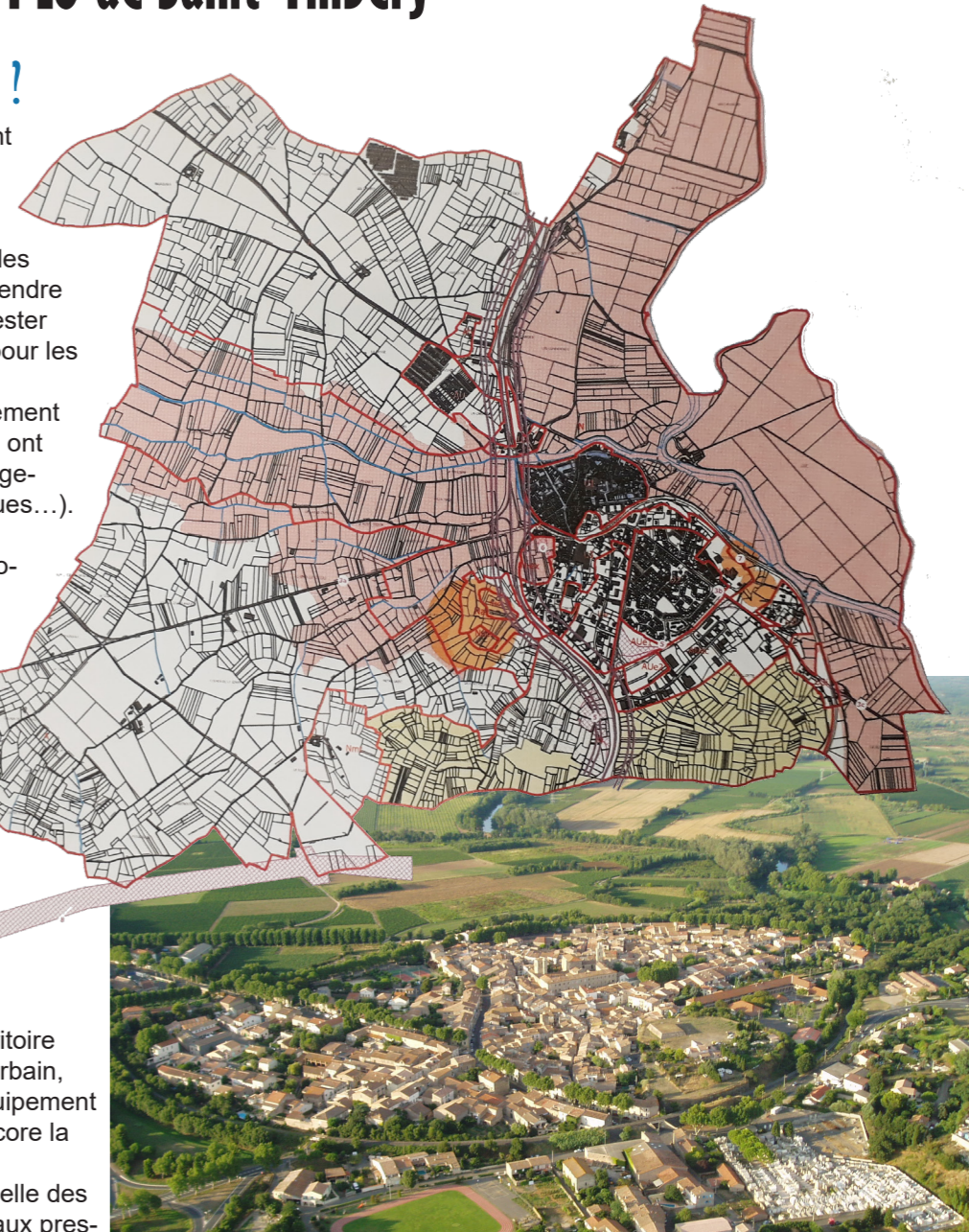
Le PLU de Saint-Thibéry est consultable sur le site internet de la commune www.ville-saint-thibery.fr menu «Cadre de vie» / Rubrique «Urbanisme».

C'est aussi un document de planification urbaine et d'aménagement du territoire qui organise et définit le développement urbain, réserve des terrains pour la création d'équipement publics, l'activité agricole et viticole ou encore la préservation des espaces naturels. Il s'inscrit dans un cadre plus large à l'échelle des bassins de vie et doit donc se conformer aux prescriptions d'un Scot (Schéma de cohérence territoriale) qui s'étend sur plusieurs intercommunalités.