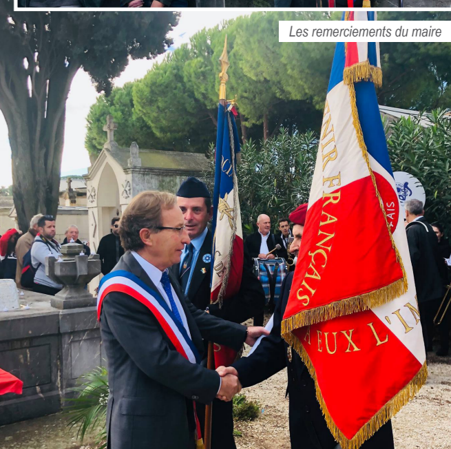
Les remerciements du maire