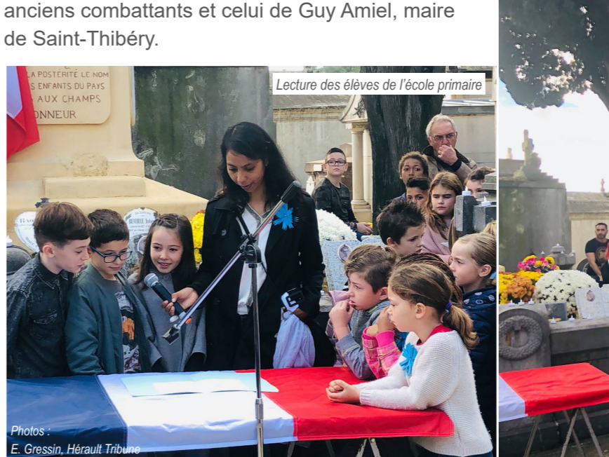
Lecture des élèves de l'école primaire