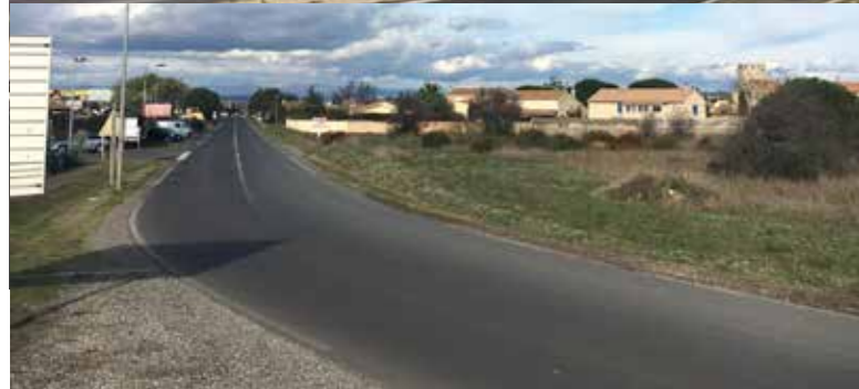
ENTRÉE DU VILLAGE ROUTE DE BESSAN