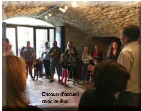
Discours d'accueil avec les élus