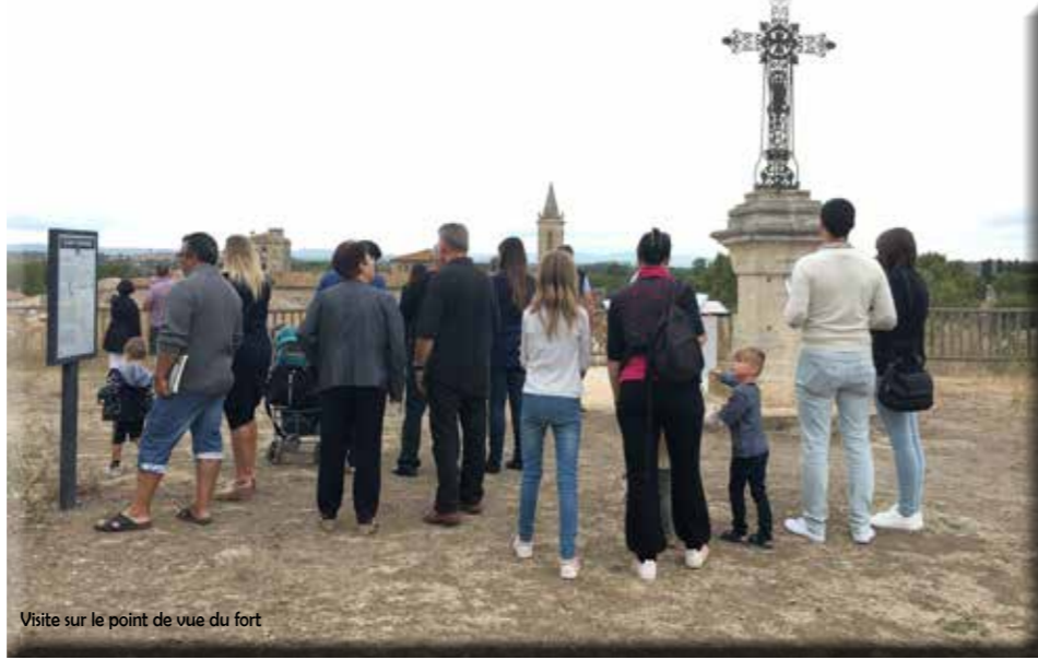
Visite sur le point de vue du fort