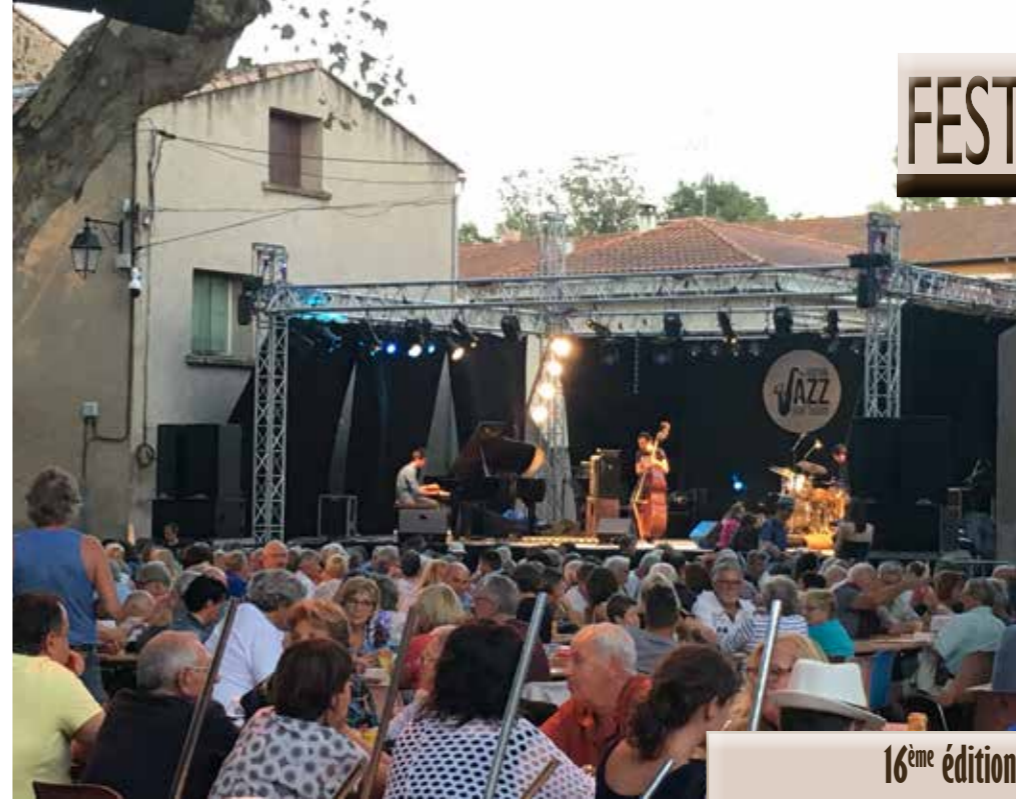
16 ème édition du festival de Jazz