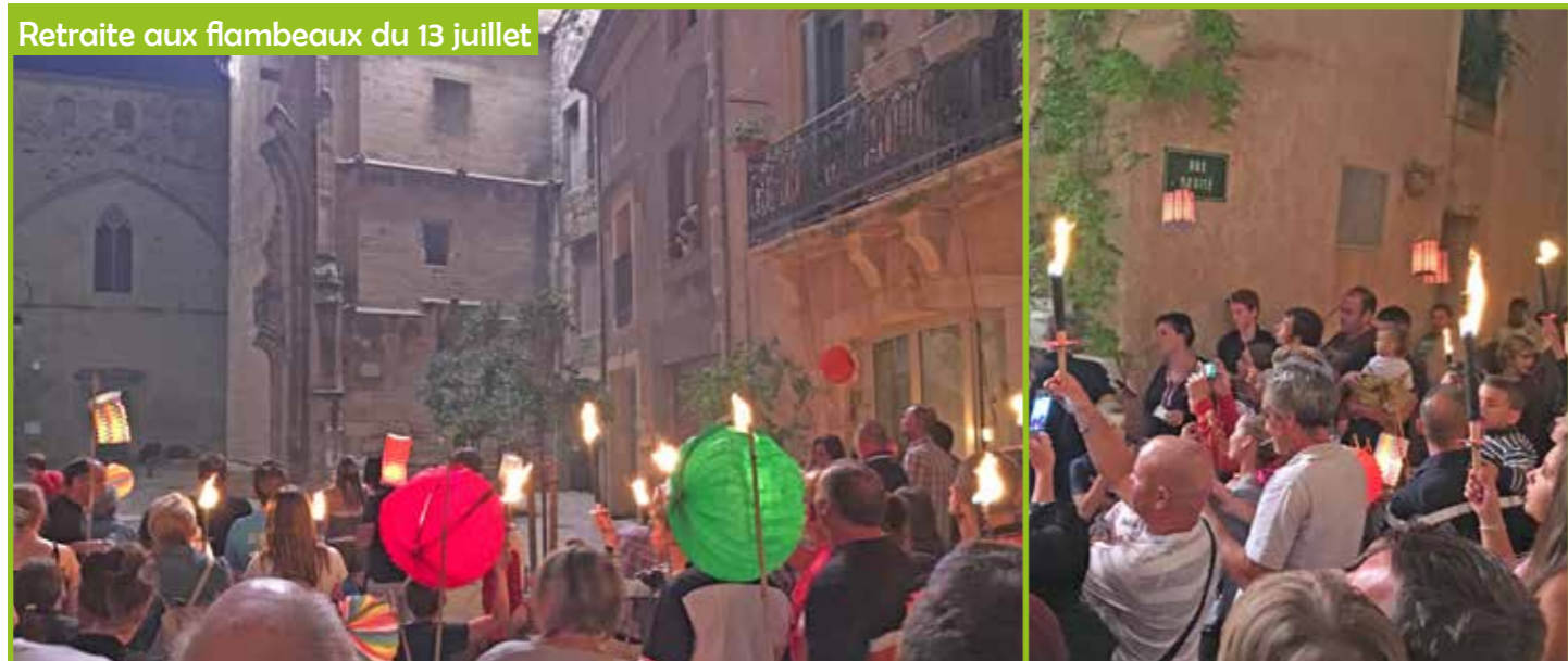
Retraite aux flambeaux du 13 juillet