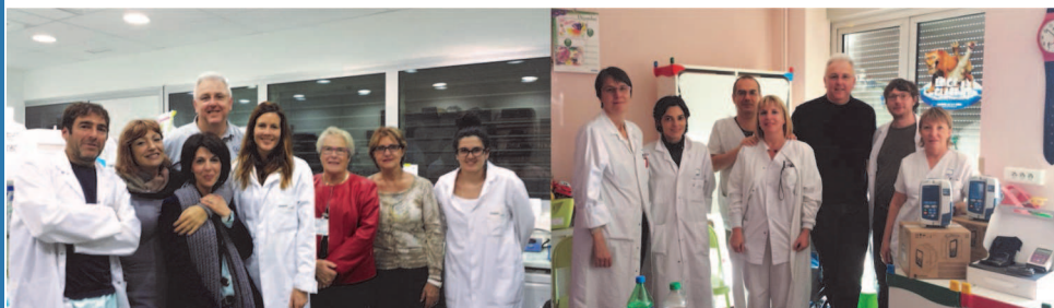
Les membres de l'association CIEL au cours d'une visite du laboratoire IRB

Août : Livraison d'un réfrigérateur-congélateur pour la salle des parents qui passent des semaines et des mois entiers dans ce service. Coût : 952 €.