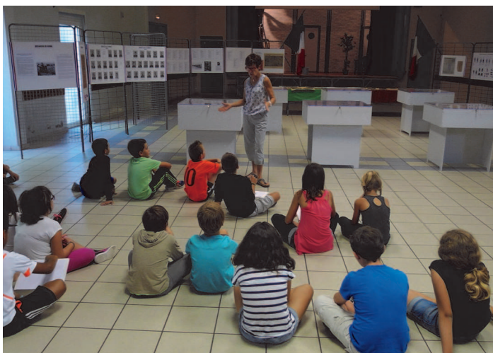
Les enfants attentifs aux explications de l'association du Patrimoine

Retrouvez les informations sur www.ville-saint-thibery.fr