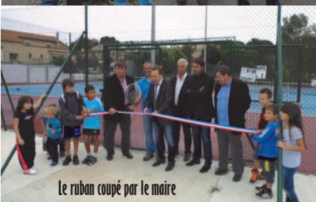
Le ruban coupé par le maire