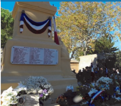
11 novembre : commémoration de l'armistice