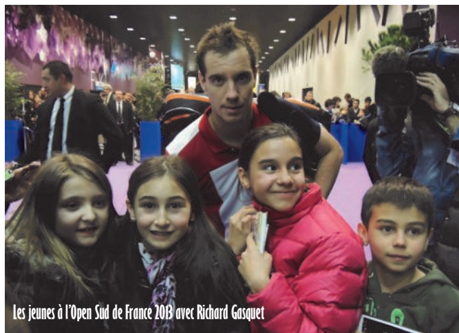
Les jeunes à l'Open Sud de France 2013 avec Richard Gasquet

Le tennis club organisera son loto le dimanche 23 février à partir de 17h à la salle des fêtes de Saint-Thibery.