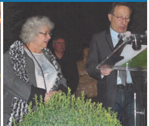
16 janvier : la cérémonie des vœux du maire