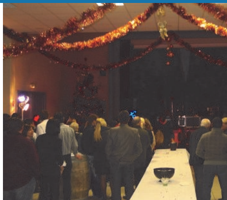
14 décembre : Noël de la mairie